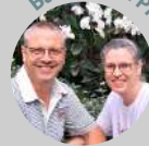
Baan Phak Phing

biedt een opvanghuis voor Thaise meisjes met een misbruikverleden.